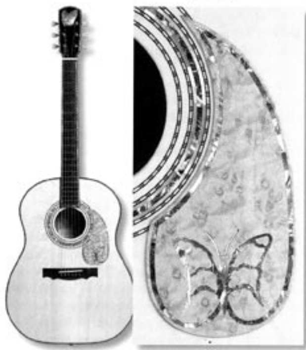
Kehlet Concert Deluxe, med detalje af slagplade

Du har jo nu opnået den ærefulde status at lægge navn til en såkaldt signature-model.