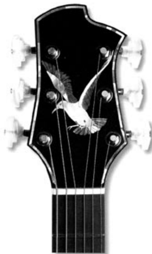
Kehlet Millennium 2000 med detalje af hoved

– “Ja, det er absolut ærefuldt. Det er første gang jeg prøver det. Olafsson-modellen er en krydsning mellem Kehlets mindre folk-model og en dreadnaught. Den er lidt mindre end dreadnaught’en, men har en større tone, et stort output og megen bund. Den er simpelthen bygget til præcis mine behov, min ultimative guitar.”